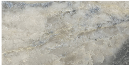
ANIKSA PULIDO P6012P