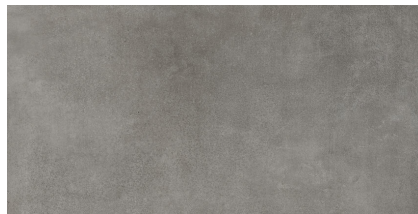
BETONHOME GREY P6012L