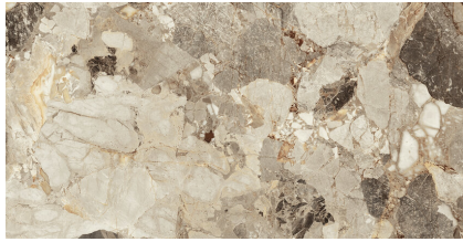
DELOS EARTH PULIDO PS6012GRP