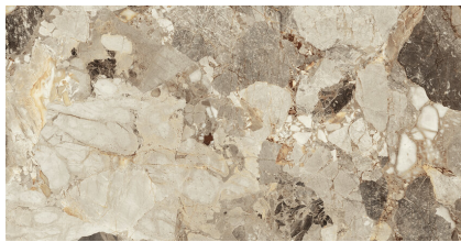
DELOS EARTH PULIDO PS6012GRP