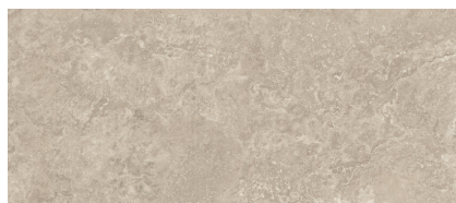
DORSTONE NUT XL2812RB