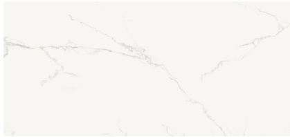
FINEZZA BIANCO NATURAL XL2612L