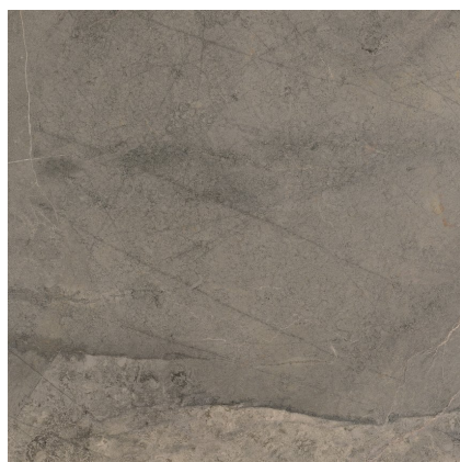
GOTHEL MOKA PR6060R