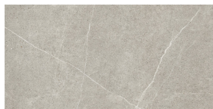
ICARIA GREY P6012L