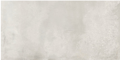
INDUSTRIAL HALL OFF WHITE P6012L