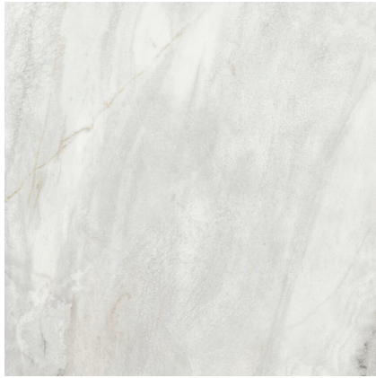
IRHAM GRIS PULIDO P1212P