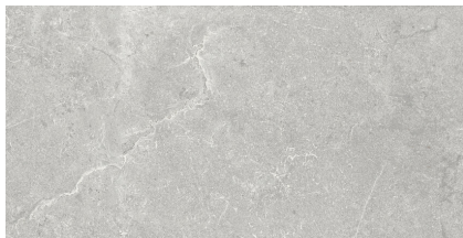
KINGSTONE ASH P6012LB