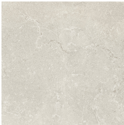
KINGSTONE CREAM PR6060LB