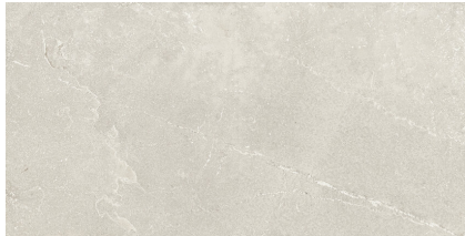
KINGSTONE CREAM P6012LB