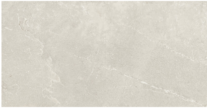
KINGSTONE CREAM P6012LB