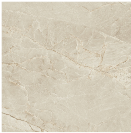
MAJESTIC CREAM SILKY PR8080LB