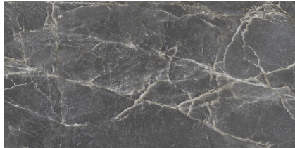
MAJESTIC DARK SILKY P6012R