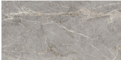
MAJESTIC GREY SILKY P6012LB