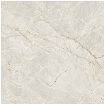
MAJESTIC PEARL SILKY P1212LB