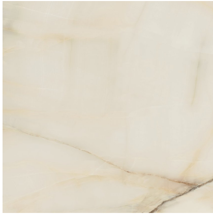
NEWBURY PULIDO PR8080P