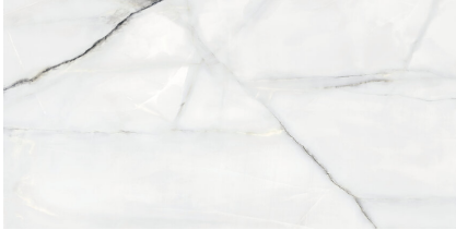
NEWBURY WHITE PULIDO XL2412V