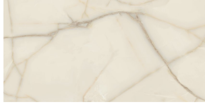
NEWBURY PULIDO XL2412P