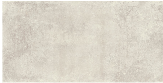
NICKON BONE P6012L