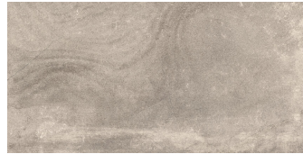
NICKON TAUPE P6012L