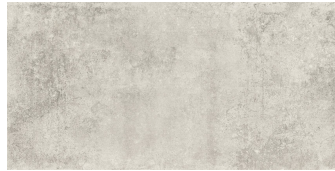
NICKON STEEL P6012L