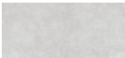
NORWIK SMOKE NATURAL XL2612L