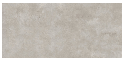
NORWIK GREIGE NATURAL XL2612L