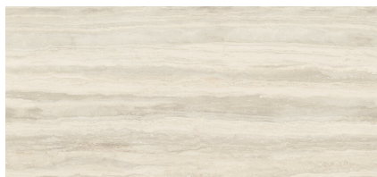
PALATINUM BEIGE XL2612L