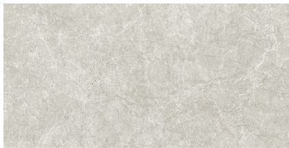
PIATRA SILVER P8016L