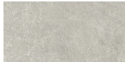
PIATRA GREY P8016L