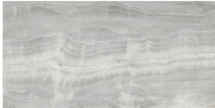
QUEEN PEARL PULIDO P8016P