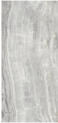
QUEEN PEARL PULIDO XL2612P