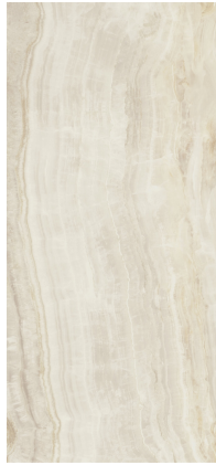
QUEEN IVORY PULIDO XL2612P