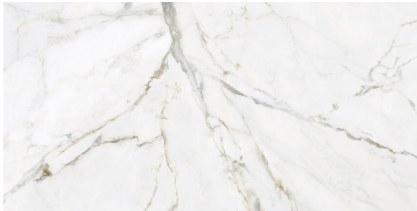
RAVENA PULIDO P6012P