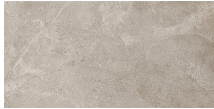
REGENSTONE SILVER P6012L