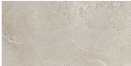
REGENSTONE CREAM P6012L