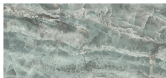
SAPHIRE JADE PULIDO XL2612GRP