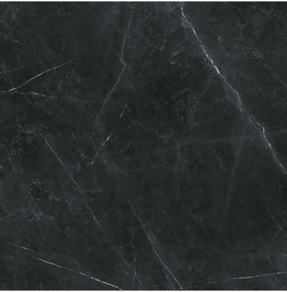
TESSINO BLACK PULIDO P1212GRP