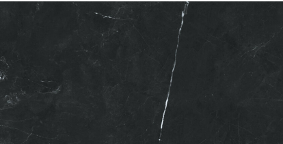
TESSINO BLACK PULIDO P6012GRP