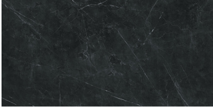
TESSINO BLACK PULIDO P8016GRP