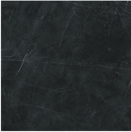
TESSINO BLACK PULIDO PR8080GRP