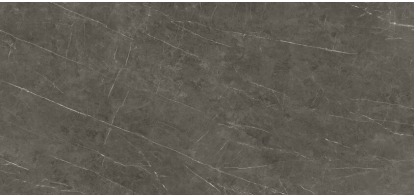
TESSINO BRONZE NATURAL XL2612E