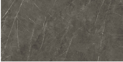
TESSINO BRONZE NATURAL P6012E