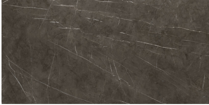
TESSINO BRONZE PULIDO P8016GRP