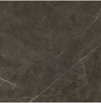
TESSINO BRONZE PULIDO PR8080GRP