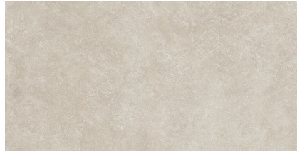
TOGA TAUPE XL2412L