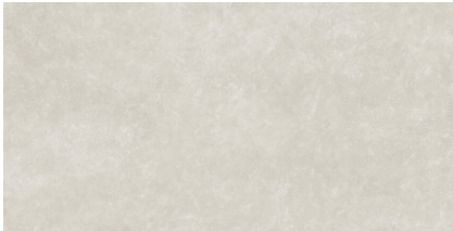
TOGA GREY XL2412L