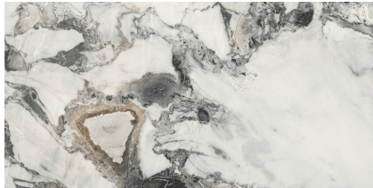
CAMELOT SILKY P6012LB