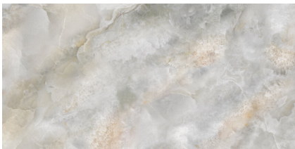
CELEBES PULIDO P8016P