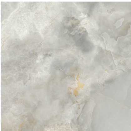
CELEBES PULIDO PR8080P