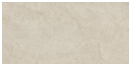
CLASSIC CREAM NATURAL P6012L