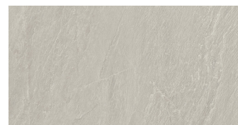
DOREX ASH P6012R