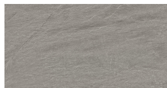
DOREX SMOKE P6012E