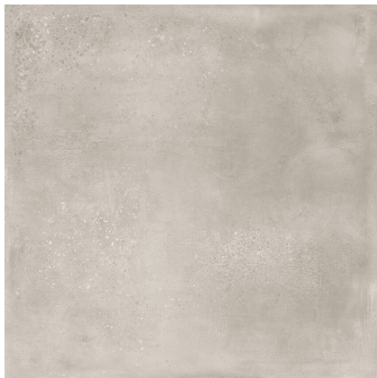
INDUSTRIAL HALL GREIGE P1212L