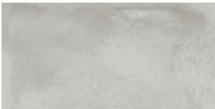
INDUSTRIAL HALL LIGHT GREY P6012L