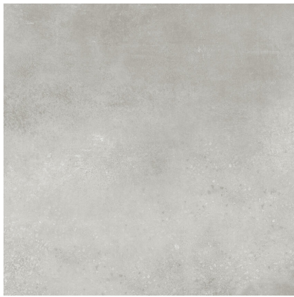
INDUSTRIAL HALL LIGHT GREY PR8080L