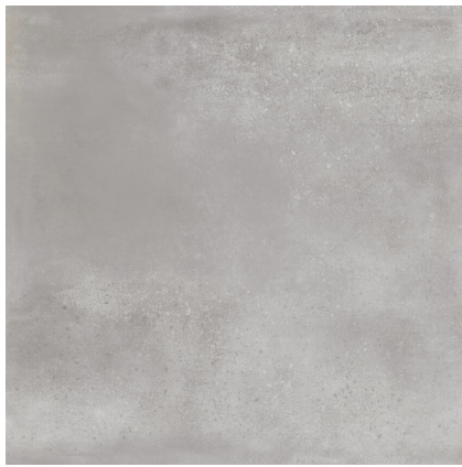
INDUSTRIAL HALL MEDIUM GREY P1212L