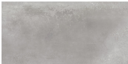
INDUSTRIAL HALL MEDIUM GREY P6012L