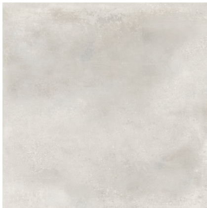
INDUSTRIAL HALL OFF WHITE P1212L