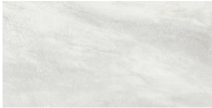
IRHAM GRIS PULIDO P6012P