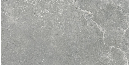
KINGSTONE GREY P6012LB